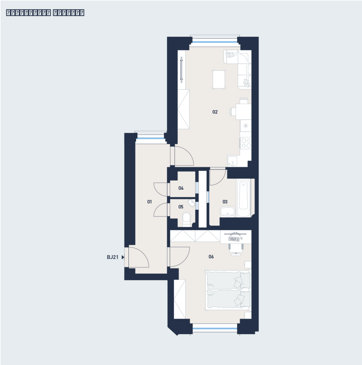
2. NP - 2+KK