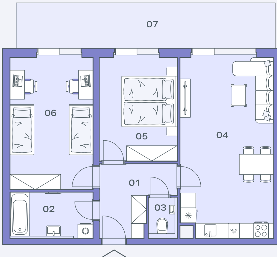
pozice v rámci budovy